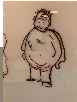
Skiss: Anne Sandahl

Under arbetet med manus letar vi vägar på många sätt. Här en skiss av Olof.